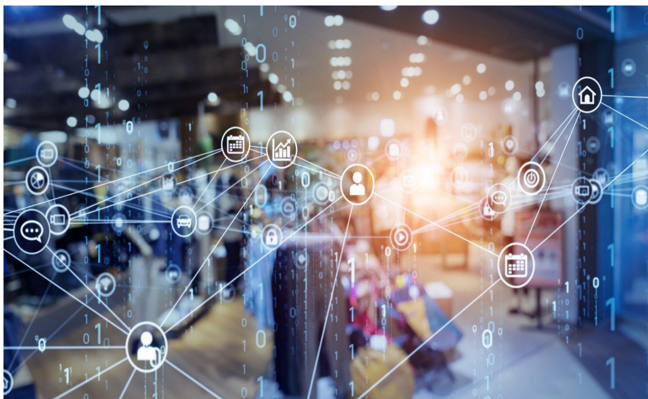
Banco de imagens

O Serviço Federal de Processamento de Dados (Serpro), maior empresa pública de tecnologia da informação do mundo, agora é parceira da Fecomércio MG. Com 56 anos de atuação, a instituição também desenvolve serviços de excelência para o mercado privado. Para apresentá-los, a Federação promoveu um webinar nessa quinta-feira (05/08), com o tema “Comércio e tecnologia: como as soluções digitais podem apoiar os negócios na retomada pós-pandemia?”.